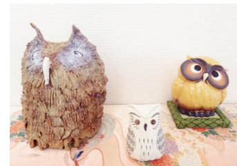
▲クリニックの玄関で会えます